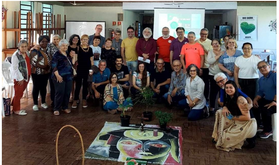
Sustentabilidade ecológica: participantes da área1