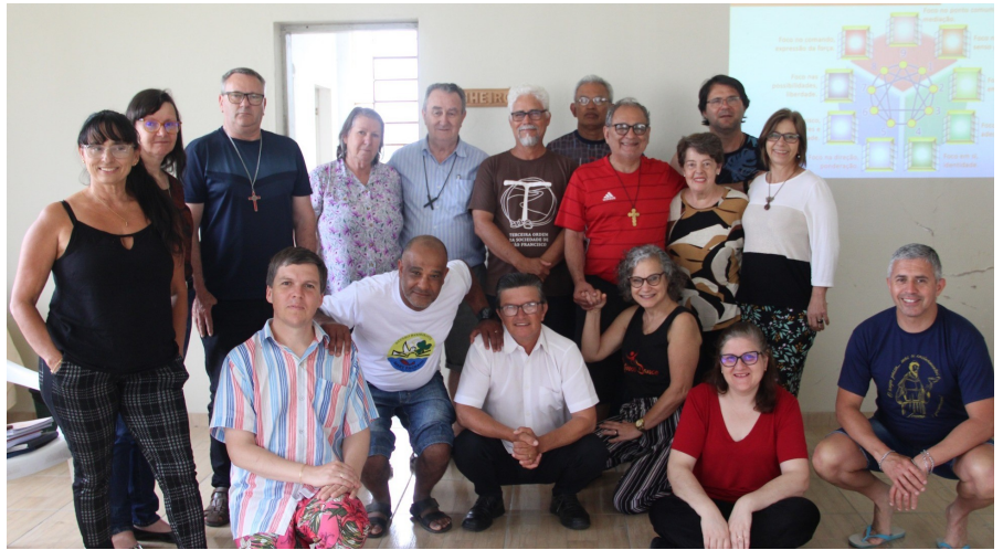
Retiro: clero, esposas e ministros leigos