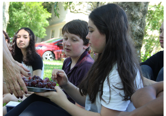
Horizonte do Reino de Deus: acolhida, partilha, respeito num tempo de ganância, individualismo, intolerância...