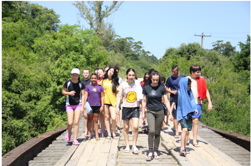
Jovens: travessia da esperança

A juventude se reconectou com o amor de Jesus de forma intensa, numa busca de intimidade com Deus com momentos devocionais, leituras bíblicas, reflexões e