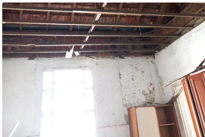
Casa paroquial: construção de 1925

Inadiável - "Fato é que o restauro tornou-se inadiável", diz Bispa Meriglei, que nos seus cinco anos de episcopado não tem medido esforços para regularizar, restaurar e