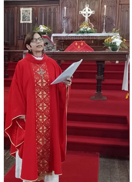
"Voluntários e solidariedade"

O concílio aprovou que o quarto domingo do mês será dedicado à juventude.