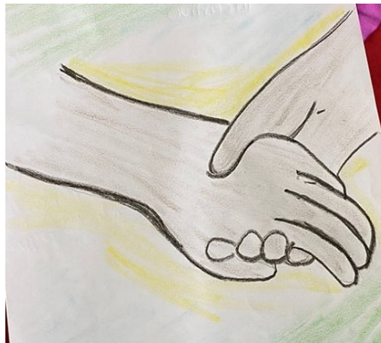
Desenho: encontro jovem ÁreaUm pós-desastre.

Os desastres tiraram tudo do lugar, inclusive o sonho das pessoas. O trabalho agora não é só reconstruir casas e repor móveis. Também se faz necessário remendar histórias, construir objetivos de vida. Significa resgatar o tecido social, que é a base da reconstrução do