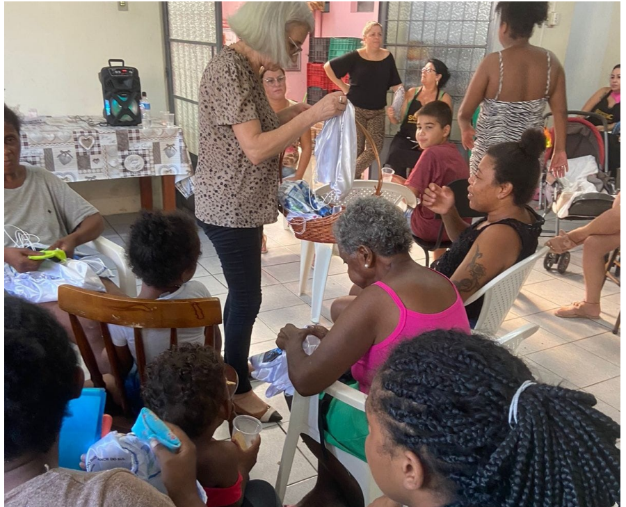
Amar: momento de confraternização e integração

Dois projetos, em convênio com a Prefeitura Municipal, estão em andamento: Tecendo Cidadania e ASEMA Ciranda (Apoio Sócio-Edu-