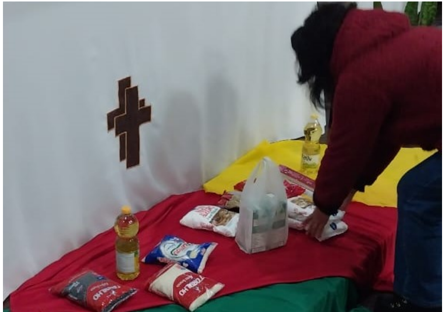
Ofertas trazidas ao altar: alimentos não perecíveis às pessoas desabrigadas das enchentes no Rio Grande do Sul

A liturgia preparada pelo Conselho Nacional de Igrejas Cristãs (CONIC), foi adaptada do texto produzido pela comissão ecumênica de Burkina Faso , coordenada pela Comunidade Chemin Neuf (CNN). Comunidade Católica com vocação ecumênica, nascida em Lyon na França, em 1973.