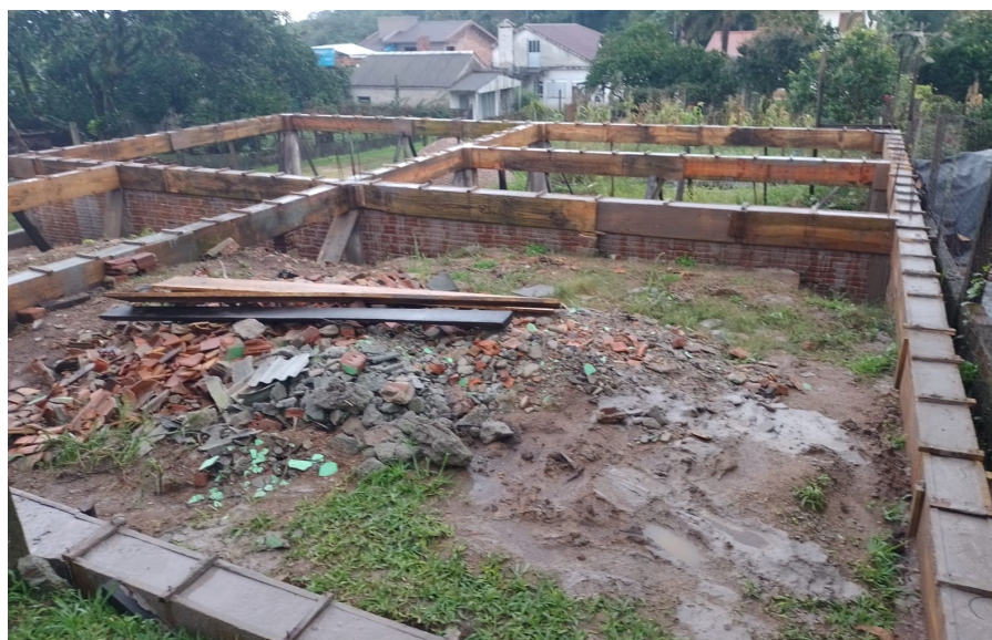
Salão comunitário: sonho se fazendo realidade

Texto de Leonardo Zaromski com colaboração de membros do ponto de evangelização.