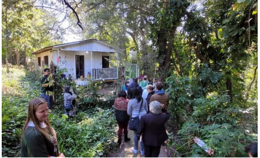
Casa da Mata: centro de acolhida

Diversos espaços - Atualmente, a pastoral utiliza diversos espaços dentro da comunidade, como o pátio, a trilha ecológica, o salão paroquial e o centro de acolhida Casa da Mata, para oferecer serviços como Bênção da Saúde, Meditação, Yoga Comunitária, Círculo de Mulheres, e muito mais. Além disso, a Eco Saúde busca desenvolver projetos pastorais em parceria com outras entidades, visando o