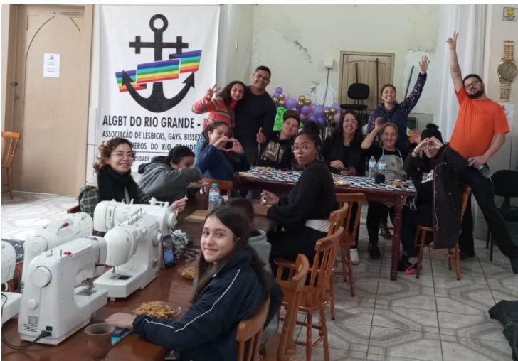
Salão e casa pastoral da paróquia do Salvador são transformados em espaço de acolhida

A tragédia climática, com o transbordamento da Lagoa dos Patos, inundou ruas e casas, desabrigando muita gente. Rio Grande está entre as cidades atingidas no estado. Mais de 600 pessoas sem ter para onde ir foram acolhidas nos abrigos da Prefeitura Municipal. A paróquia do Salvador colocou seu espaço à disposição do município.