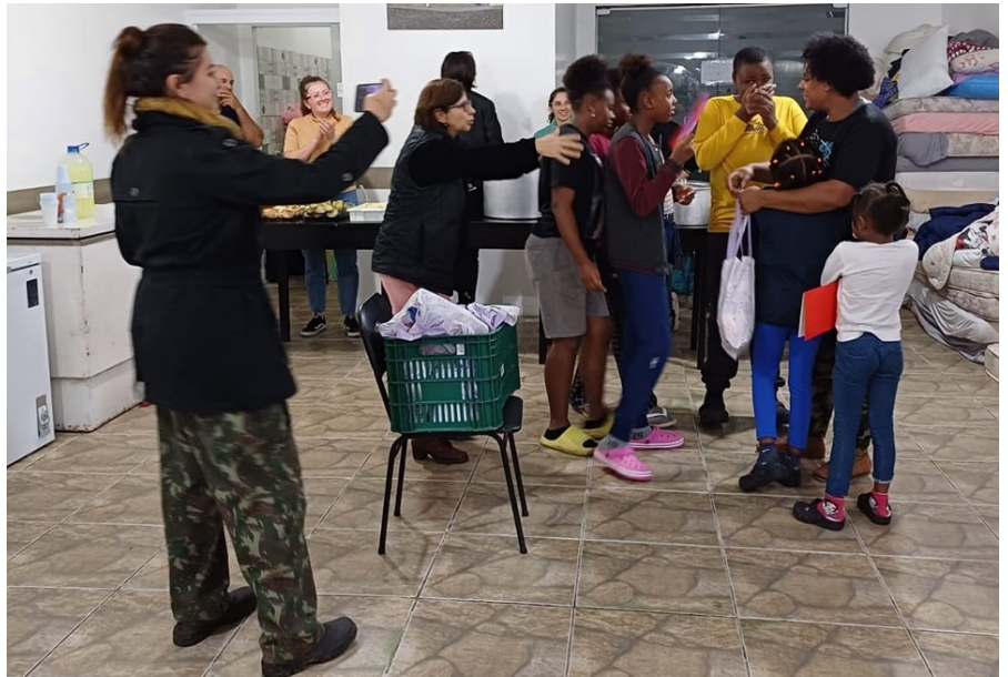
Após tempo de acolhida, tempo de retornar para casa

O Rio Grande do Sul enfrenta a pior tragédia causada por enchentes desde 1941. Dos 497 municípios