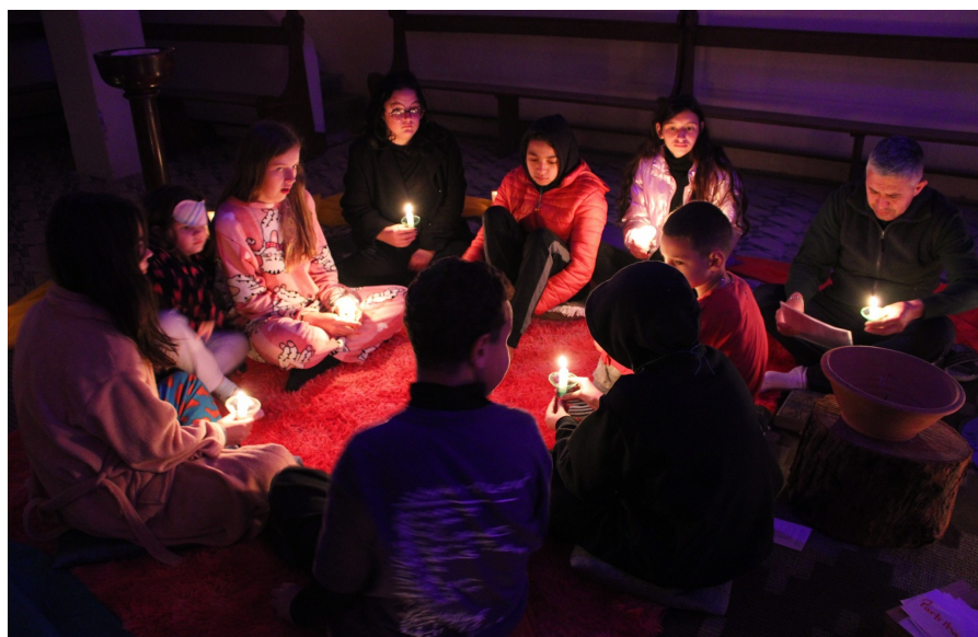
Vigília: silêncio e emoção

Mas muita coisa estava ainda por acontecer. Orar, refletir, cantar, correr, dançar, sorrir. Sonhar com a paz, abraçar um amigo, colocar-se no lugar do outro. Emocionar-se. Encantar-se. Enfim, viver intensamente. Tantas emoções. Sentimentos. Aspirações. Tudo isso acabou registrado em pequenos pedaços de madeira, fixados em vários lugares para reflexão. Com certeza foi bom sentar-se à sombra de figueiras centenárias. Assim como ouvir o cantar dos pássaros, contemplar o bailar das nuvens, viver a experiência da trilha, a travessia da ponte e o molhar-se nas águas mansas do Arroio Moreira. Experiência que ficará em cada qual dos participantes do REPEL para sempre.