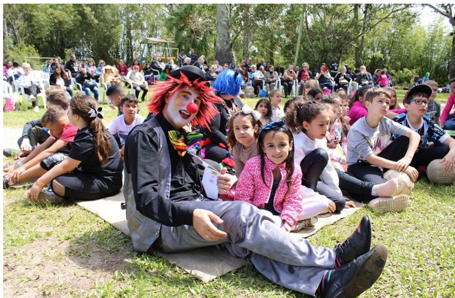
Família diocesana: unidade, fraternidade e muita alegria

A programação era bem variada. Além das celebra-