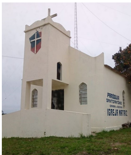
Florida: templo construído em 1980. Presença anglicana: desde 1903

Participaram ainda representantes ecumênicos: Igreja Católica Romana, Igreja Batista e Igreja Voz do Brasil para Cristo. Um testemunho de unidade e fraterno amor. Após a celebração todos se dirigiram para o salão paroquial, onde foi servido um gostoso "café colonial" com uma variedade de pães, salgados, cucas e bolos. Tudo preparado pelos membros da paróquia.