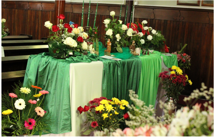
Festival de Flores: beleza e emoção

Momento devocional marcou a abertura do evento, sábado à tarde, 21 de outubro. Seguiram-se apresentações de corais, grupos de música e instrumentistas. Flores, música e gastronomia encantaram os visitantes que contemplaram emocionados a beleza das flores e os arranjos artisticamente confeccionados. Vários deles puderam ser adquiridos. A programação se estendeu até Domingo à tarde.