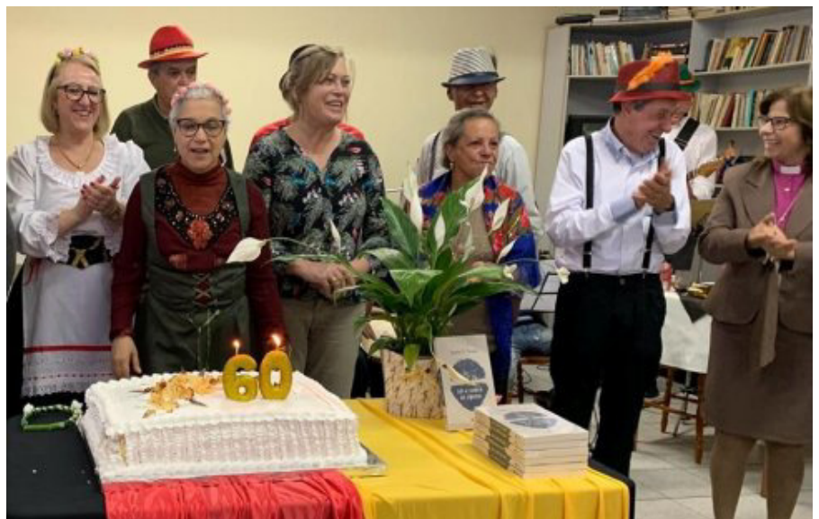
Santíssima Trindade: tempo de espiritualidade, convivência e muita alegria

Uma programação especial marcou essas conquistas. Celebrações oficiadas pela liderança leiga e pelas mulheres, com ênfase no Outubro Rosa . Na celebração das mulheres o núcleo da UMEAB da paróquia de São João Batista ofertou um belo lírio da paz. Houve também celebração para renovar os votos da Irmandade da Santa Cruz e a acolhida de uma nova paroquiana.