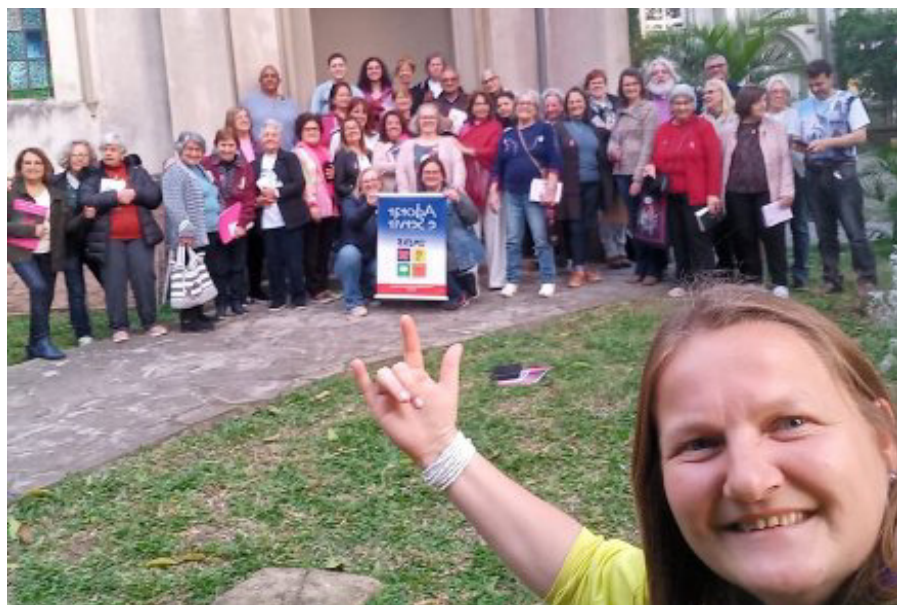
UMEAB (Area UM): aponta novos caminhos, com um novo jeito de ser

Pelotas), que presidiu a celebração de encerramento na paróquia da Ascensão, “o encontro revelou um novo jeito de ser UMEAB nos dias de hoje”. Destaca sobretudo que se pode vislumbrar novos caminhos com a participação efetiva das mulheres num tempo de transformações e expectativas. “As mulheres têm sido protagonistas e contribuem efetivamente na proclamação e vivência do Evangelho”, conclui.