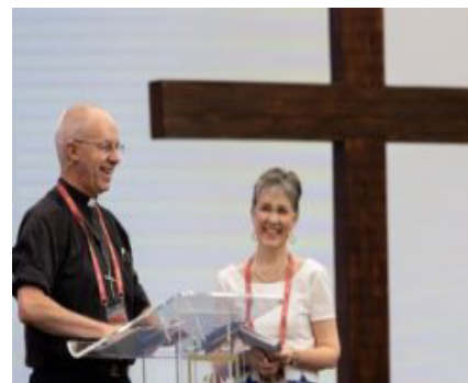
Arcebispo Justin e esposa Caroline, em Kent: acolhida calorosa aos participantes da Conferência de Lambeth

(Importante: Edição especial da Boas Notícias com informações e fotos da Conferência será publicada em setembro/22).