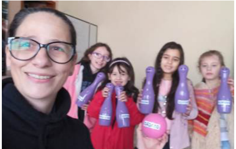
Crianças: “nosso dever é dar espaço e acolhê-las...”

Com gestos liderados pelas professoras, as crianças apresentaram uma bela canção que fala dos diferentes tipos de pai: “tem pai magrinho e pai gordão. Tem pai careca e pai bigodão”. E repetiam com entusiasmo o refrão, que dizia: