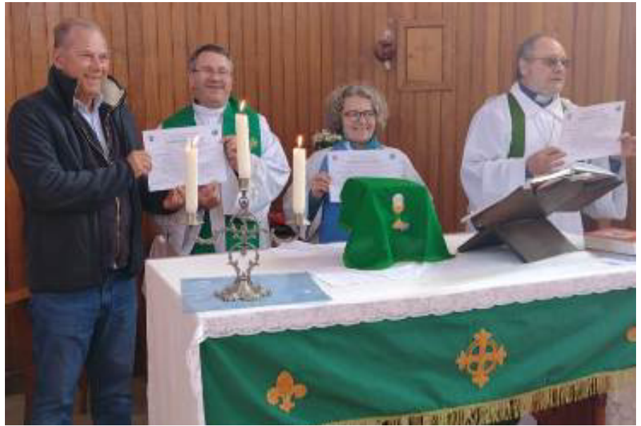
“Companheirismo”: paróquias de Cristo (Jaguarão) e Salvador (Rio Grande)