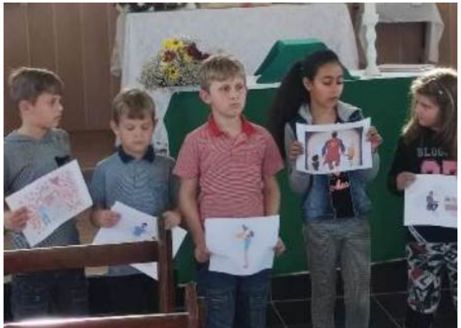
Escolinha Tia Euza: “Pai! A certeza de um amigo para sempre”!

N o contexto da celebração do dia 14 de agosto, as crianças da Escola Dominical apresentaram uma emocionante homenagem aos pais. Algumas mostraram o trabalho “artístico” que fizeram, enquanto outras compartilharam um texto com palavras de gratidão. No final do ofício de ação de graças distribuíram um belo cartão “para o melhor pai do mundo”, com os dizeres: “Pai! A certeza de um amigo para sempre”. A Escolinha da “Tia Euza”, em atividade ininterrupta na paróquia por mais de 50 anos leva muito a sério a Educação Cristã, encorajando a presença e a participação das crianças na igreja.