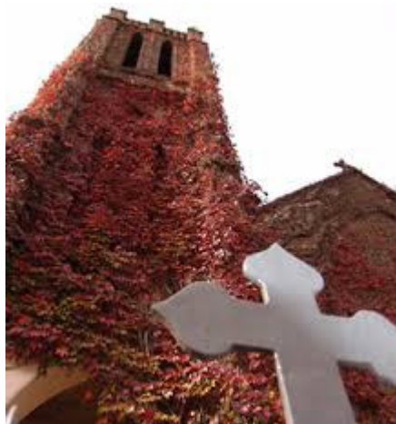
Catedral do Redentor