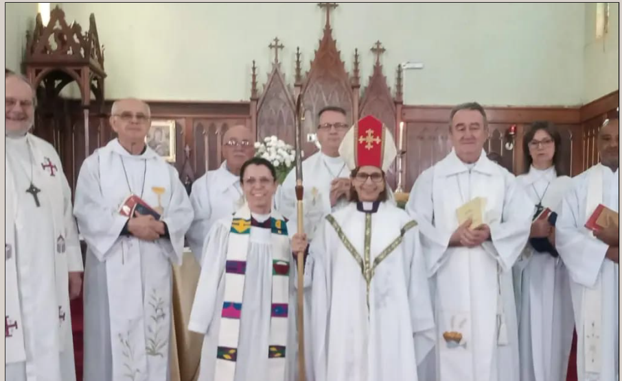
Bispa e clero: sinal de unidade

Houve também a tradicional bênção dos óleos, usados no sacramento do Batismo, na Confirmação e na Unção dos Enfermos. Aconteceu ainda a cerimônia do lava-pés, que lembra o ato de Jesus na Última Ceia, quando lavou os pés dos discípulos. Ato simbólico da vocação para servir. Em sua mensagem Episcopal, Meriglei destacou que “todos nós