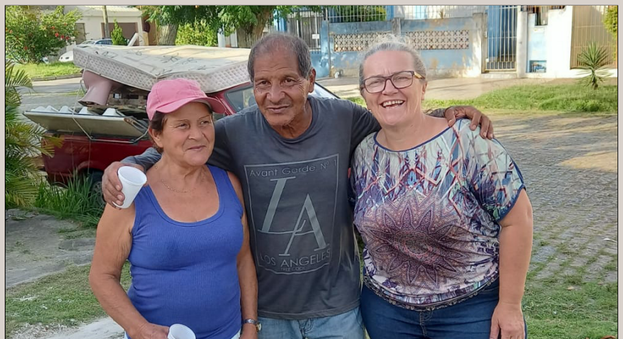
Voluntários: servindo com alegria e amor

Casa Pastoral e Salão Paroquial foram posteriormente construídos e sediaram ali o Seminário Teológico e a redação do Estandarte Cristão, periódico da Igreja.