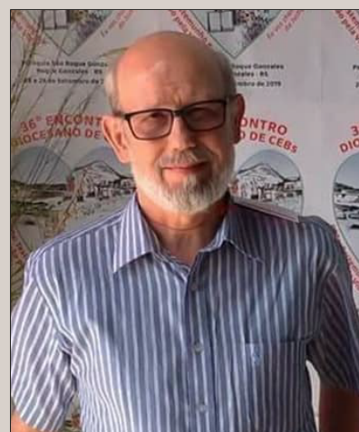
Ildo Bohn Gass: Evangelho de Lucas