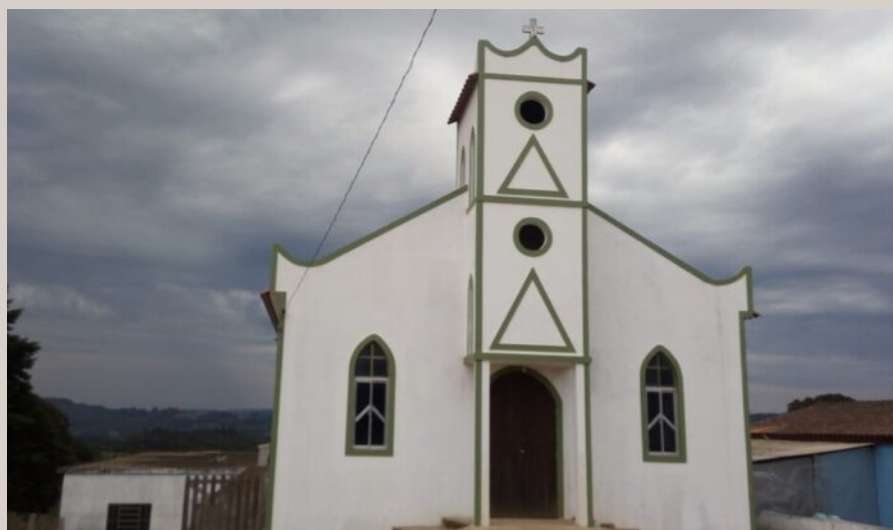
Legenda: Templo da Paróquia Santo André

Já foram adquiridos instrumentos musicais, computadores, impressoras, material didático e lúdico, além de utensílios e