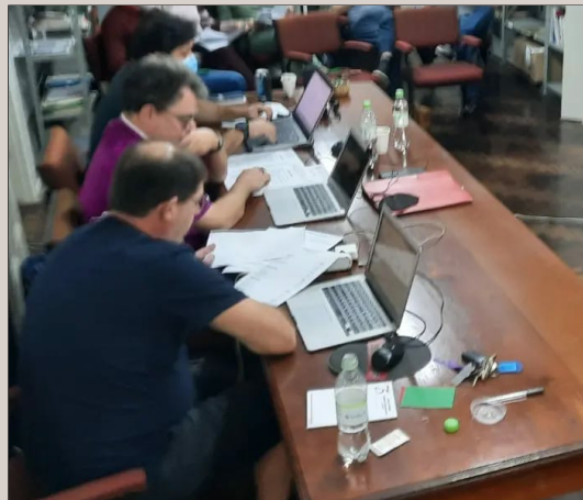
Tecnologia: concílio presencial e virtual