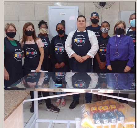
Padaria-Escola: capacitação, oportunidade