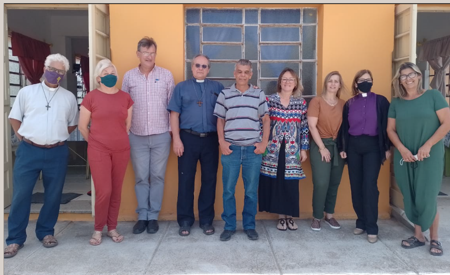
CASE: visita do staff diocesano

recebem alimentação variada e saudável. As hortaliças são produzidas no local.