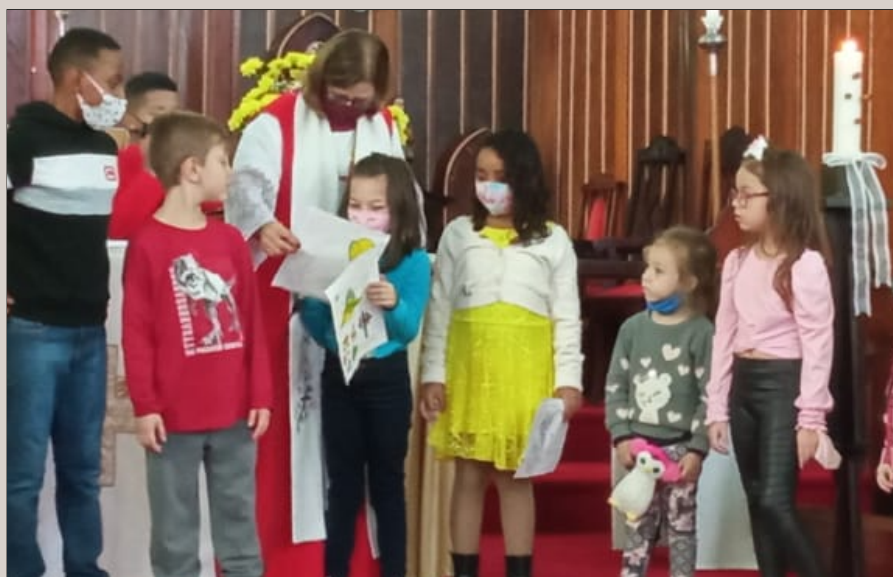
Educação Cristã: paróquias e missões retomam atividades com crianças

Segundo informações de orientadores de Educação Cristã e clero, as paróquias