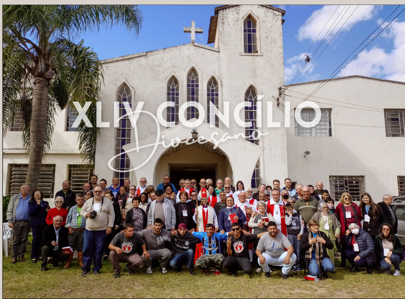
Concílio: delegação conciliar e congregação.

O Concílio começou Sexta-feira, 29 de abril, com celebração eucarística e leitura da Carta Pastoral ( leia síntese p. 2 ) No sábado pela manhã o Revdo. Ariel apresentou estudo sobre quatro modelos de Igreja: tradicional, comunitá-