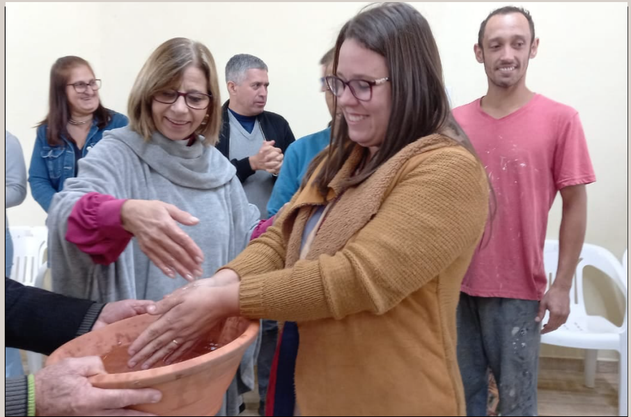
Lavar as mãos: gesto de compromisso

Assembleia Diocesana - À tarde aconteceu a Assembleia Diocesana do Povo de Deus,