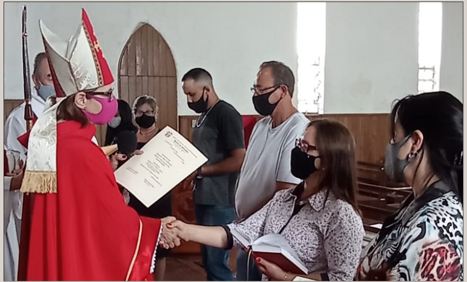
Visita Episcopal: pessoas Confirmadas e recebidas na comunhão da Igreja

A Paróquia do Salvador é reconhecida no município de Canguçu por seu testemunho fiel na proclamação Evangelho e serviço junto a uma comunidade plural e notável espírito ecumênico.