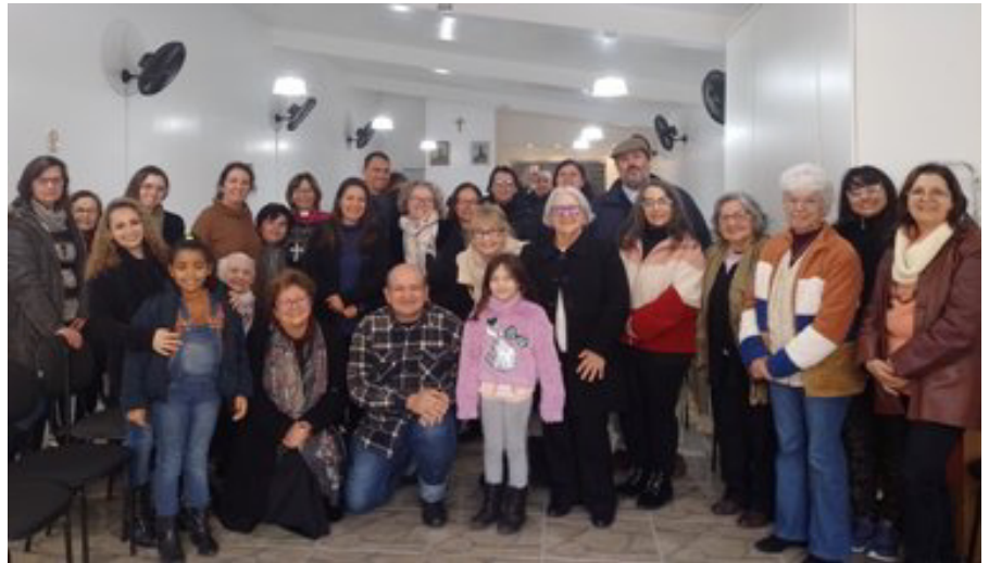
Liderança e grupo: tema do segundo encontro presencial em 2022 Paróquias, missões e pontos de evangelização representados

Em janeiro de 2022 realizou-se o primeiro encontro presencial, sob o tema Relacionamento com Deus, com as outras pessoas e com nós mesmos . Já o tema do segundo encontro tratou de Liderança e Grupo . Participaram representantes de várias paróquias, missões e pontos de evangelização. Houve dinâmicas e jogos para compreender o dinamismo interno dos grupos e a diversidade de lideranças. A