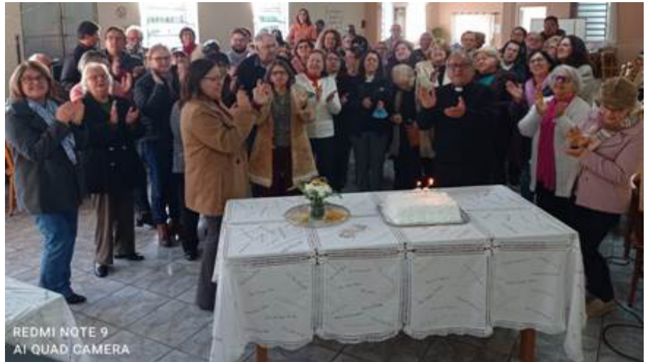
Celebrando 72 anos com oração, reflexão, música, bolo e alegria