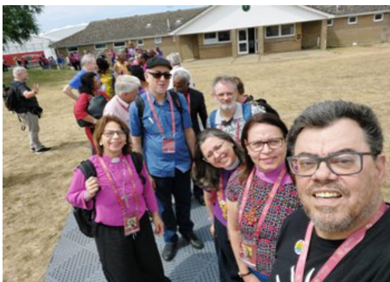
Universidade de Kent: parte da representação brasileira