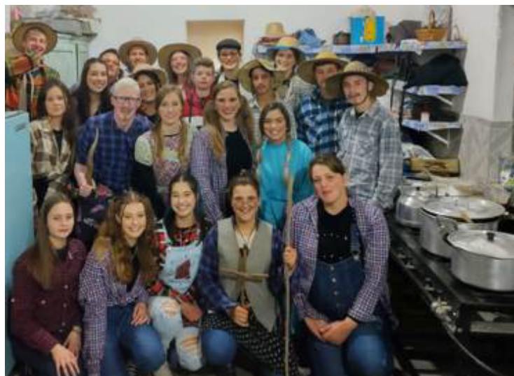
Festa junina: jovens lotam salão paroquial em Santa Helena; casamento caipira, dança de quadrilha e música boa a noite toda

panhar o ritmo da música o pessoal dançou e se divertiu até o amanhecer.