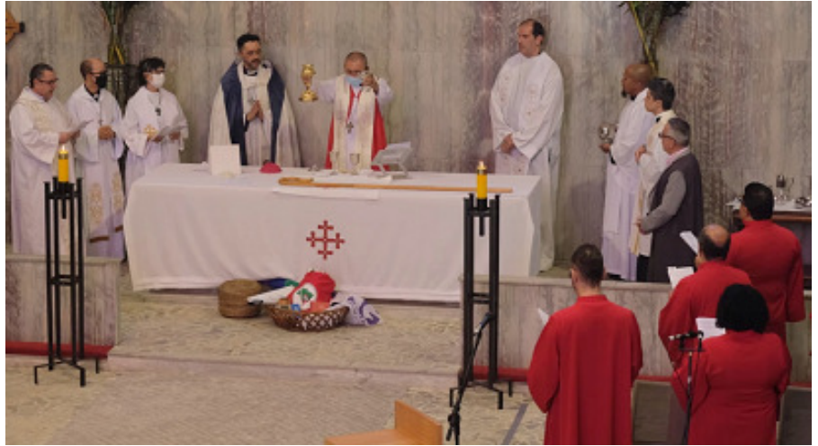
Bispo diocesano preside Eucaristia: co-sagrantes Deão e clero diocesano