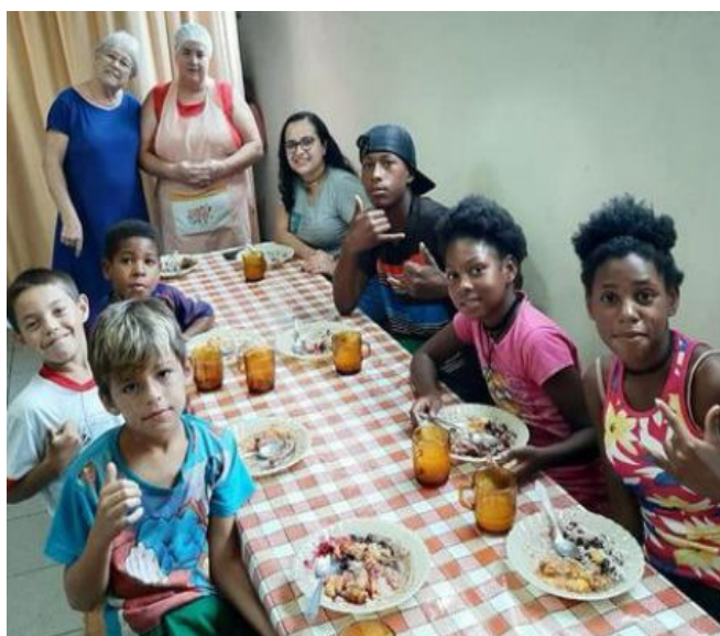
Associação Amar: reforço escolar, música, dança, alimentação e muito amor e carinho

e Desenvolvimento) e ERD (Apoio Episcopal para o Desenvolvimento) possibilitam a aquisição de instrumentos musicais, material escolar e segurança alimentar.