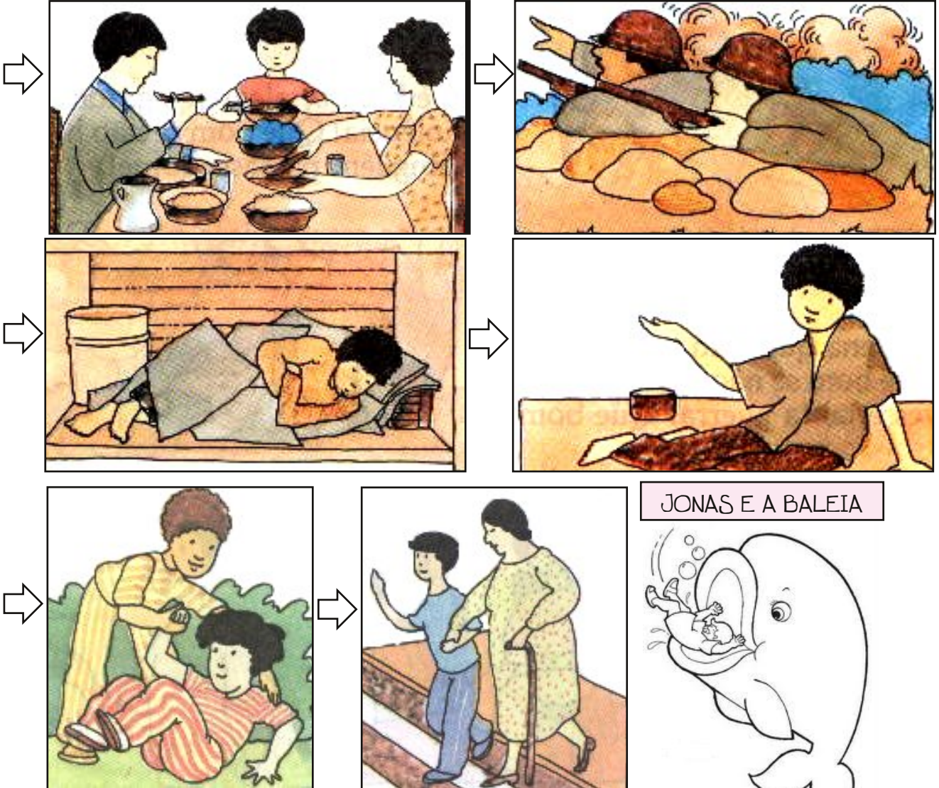
JONAS E A BALEIA

1. Pinta a flecha de azul, se indica o que é BOM, e de marrom, se indica o que é RUIM!