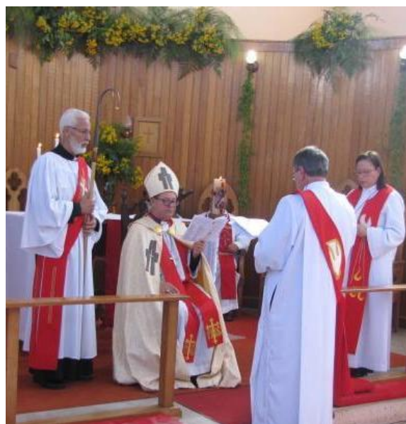
Exame Canônico: votos de ordenação