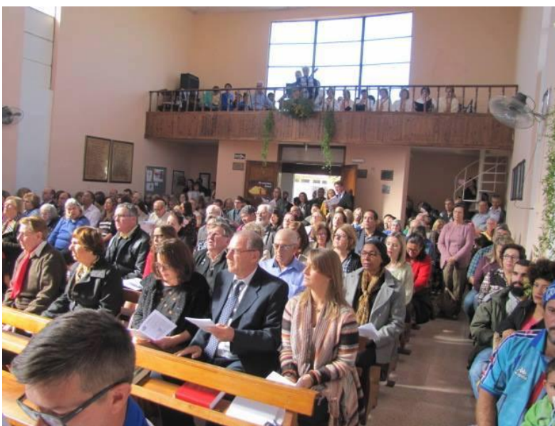
Templo lotado: delegação, convidados, paroquianos...