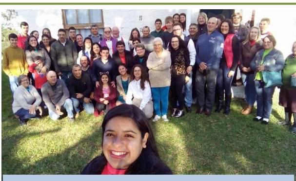
Congregação do Ponto de Evangelização São Pedr - Assentamento Herdeiros da Luta