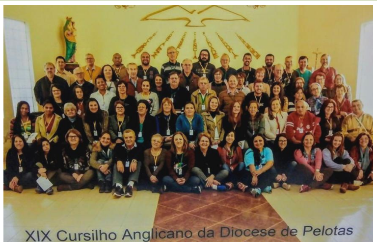
XIX Cursilho Anglicano da Diocese de Pelotas

A Junta Paroquial do Amor Divino , interior de Pelotas, investe na Educação Cristã. Participa de estudos bíblicos. Integra grupo de música. Incentiva as crianças a participarem da Escola Dominical. Foto: Escola Dominical, dia 23 Julho.