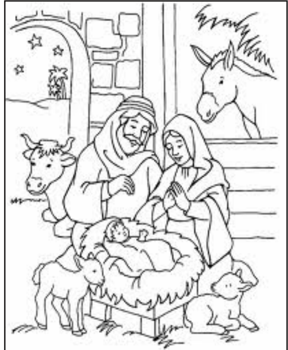
JESUS, JOSÉ E MARIA