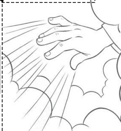
DEUS FILHO NA RESSURREIÇÃO

3. Completa, colocando os nomes da Três Pessoas da Santíssima Trindade: