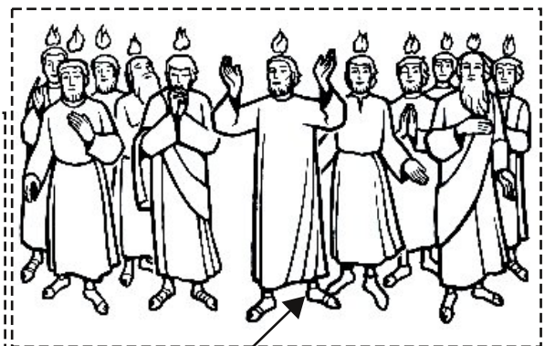
DEUS ESPÍRITO SANTO NO PENTECOSTES