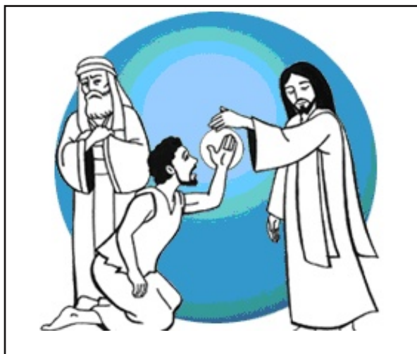
JESUS CURA A MÃO DO HOMEM!

1. Completa, de acordo com São Marcos 3:5!